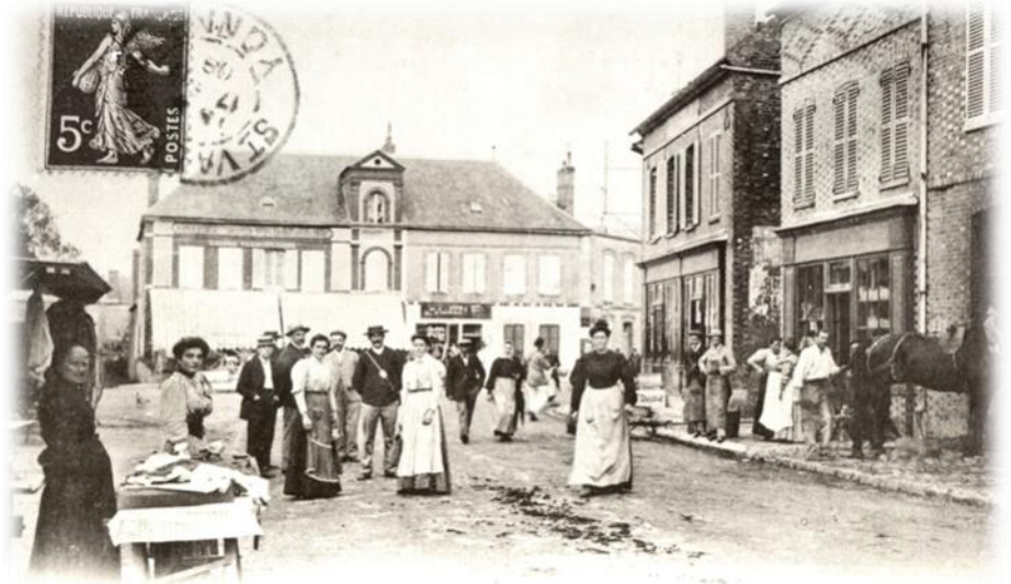
8. SAINT-VALÉRIEN — Un Vendredi

L es relevés présentés dans ce document sont ceux que nous avons recueillis dans les registres officiels puis sélectionnés d'une manière sans doute subjective mais qui, selon nous, peuvent servir d'appui à une étude approfondie de la vie d'une commune du Gâtinais.